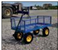
Trækvognen er blevet samlet.