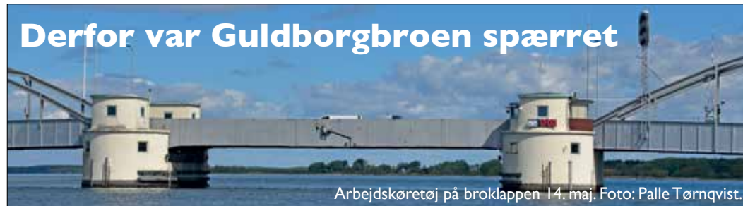
Arbejdskøretøj på broklappen 14. maj.

Der er afsat ekstra beløb til reovering og modernisering af Guldborgbroen i 2019 på 7 mill. kr. Nu anvendes 1.3 mill. kr til pullerter og bomme samt 200.000 kr. til øvrig vedligeholdelse. Det resterende beløb på 5.7 mill. kr. flyttes til reovering og ombygning af "Cementen" i Nykøbing, "hvor der i flere år har været ønske om en gennemgribende reovering. Der fremlægges konkret sag herom på udvalgets møde i august". Udvalget tilsluttede sig anbefalingerne.