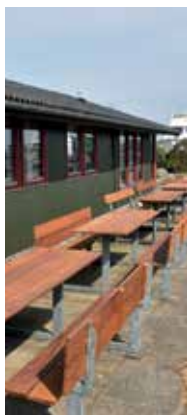
Knud Svendsens nye møblement.