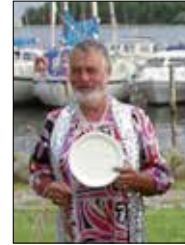
Min far - og en madskål.