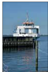
Tekst og foto: Palle Tømqvist.

Efter sommerens - indtil nu - voldsomme tordenvejr med over 6000 registrerede lyn over landet - oprandt nogle dage med sommervejr. Tonny fra Sakskøbing var parat. Vi sejlede ud ad fjorden i frisk modvind og solskin på bedstefar-vis med motorerne i "Esther" og "Sabine" summende i vinden.