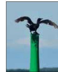
Fugle undervejs: Skarv, svale og strandskade.